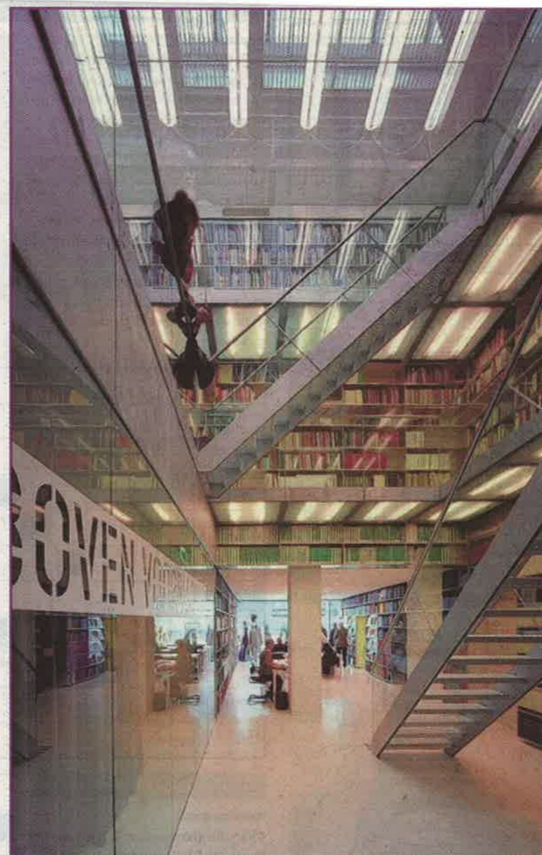
De bibliotheek van het Van Abbemuseum.

'Het Muziekgebouw', project van Orkest Zuid en de TU/e, is mee te maken op zondag 10 juni en zaterdag 23 juni in Eindhoven.