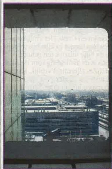
Vanaf het Vertigogebouw op de TU/e.